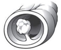
Polip Nan Kolon